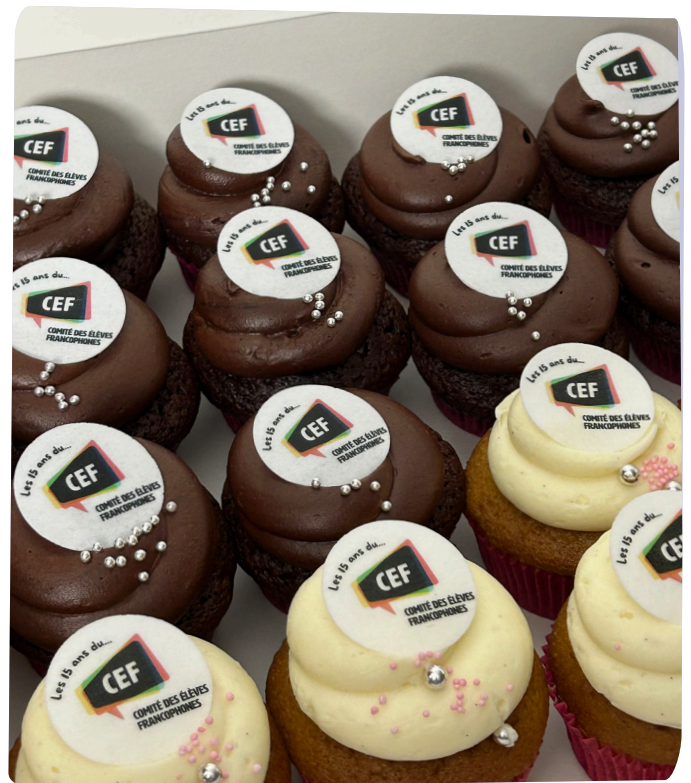
Les cupcakes servis à l'occasion des 15 ans du CEF