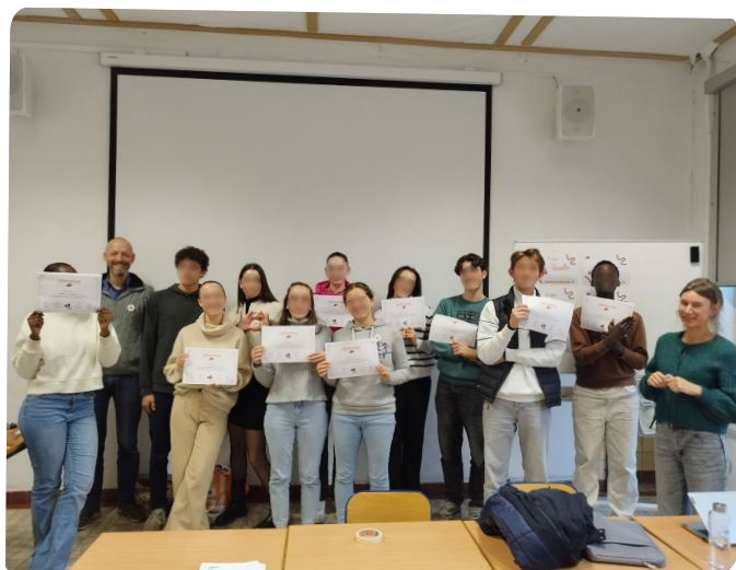
Les délégué.es de l'Athénée Royal de Namur avec leur diplôme à l'issue de la formation D-TEAM