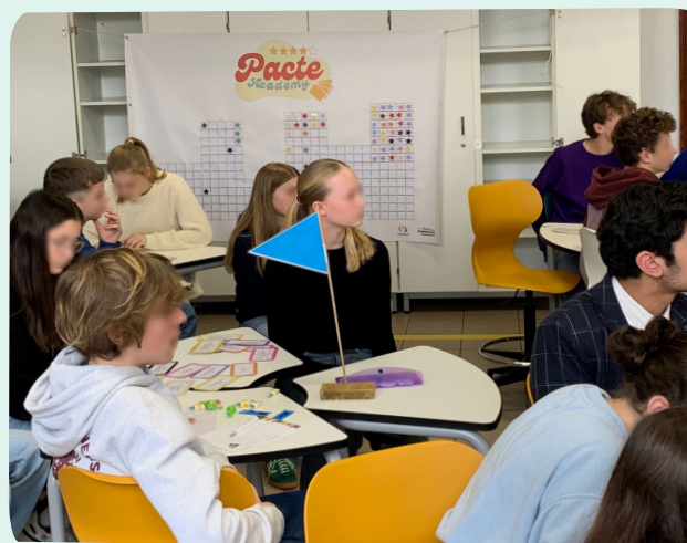
Deux groupes d'élèves lors de l'animation Pacte Academy