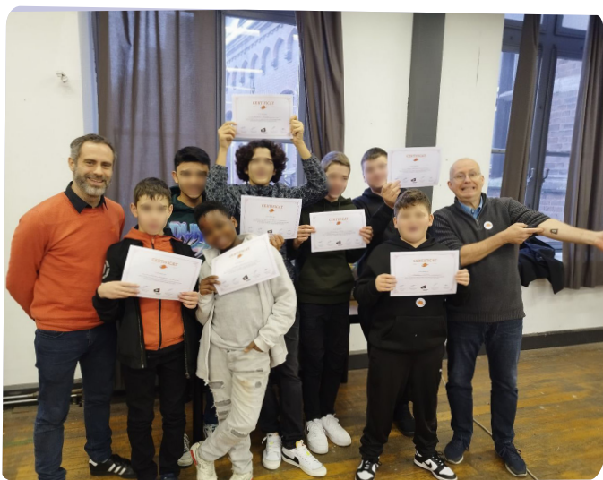
Les délégué.es de l'Institut Don Bosco avec leur diplôme à l'issue de la formation D-TEAM

Nous avons malgré tout voulu maintenir notre engagement auprès de deux écoles qui avaient sollicité notre aide depuis plusieurs mois : l'Institut Saint-Louis de Waremme et le Collège La Fraternité (site Saint-Vincent) à Bruxelles.