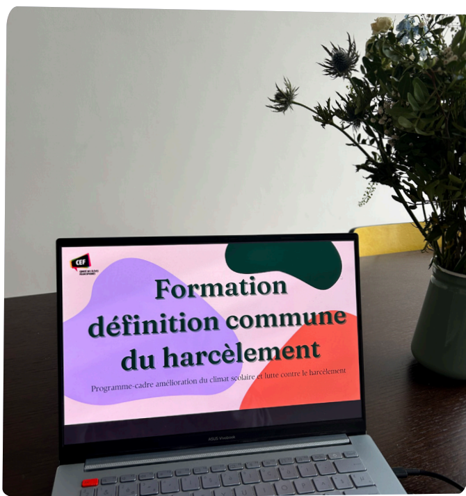
Formation à la compréhension commune du phénomène de harcèlement